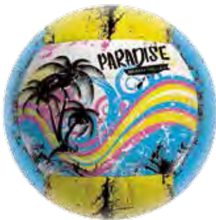
2 631357 Volleyball „Paradise“ Größe 5, genäht