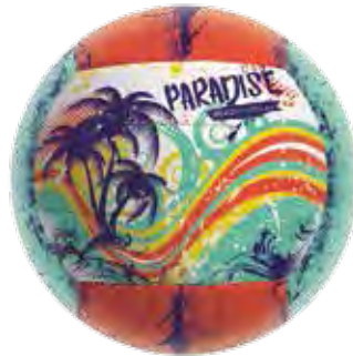
3 631196 Beach Volleyball 3 Farben sortiert, Größe 5, 270 g, genäht, Material außen: PVC