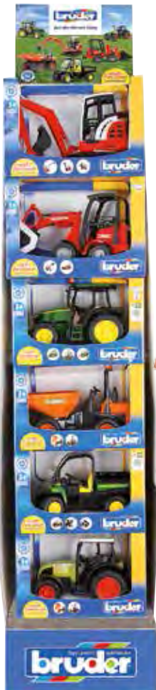
4 632426 BRUDER Kompakte Helfer Display 6 Modelle sortiert: Schaeff Minibagger, Schäffer Hoflader, John Deere 5115M, AUSA Minidumper, John Deere Gator XUV 855D, Claas Nectis 267F