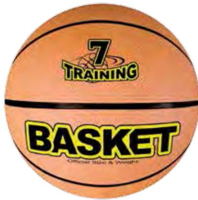
1 631353 Basketball Größe 7