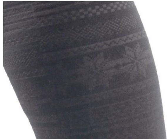
Detailaufnahme des Designs